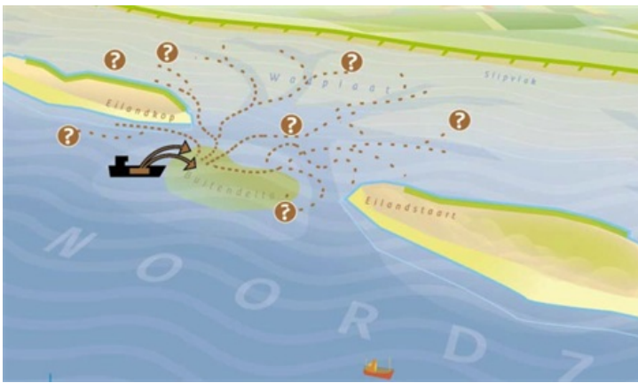
Figuur 5. Buitendeltasuppletie