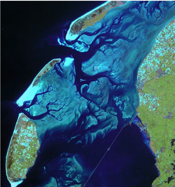
Figuur 1. Satellietfoto van de westelijke Waddenzee

De wind heeft naast het getij een belangrijke invloed op de waterbeweging in de Waddenzee. Lokaal worden golven opgewekt, waarvan de hoogte afhankelijk is van de windsnelheid, de afstand waarover de wind waait (de strijklengte) en de waterdiepte. Golven die op de Noordzee worden opgewekt, worden grotendeels gedempt op de buitendelta. Tijdens stormen kan de wind ook zorgen voor een sterke opzet van het water. Dit gebeurt grotendeels op de Noordzee, waar de opzet tijdens de stormvloed van 1953 bijvoorbeeld 3 meter bedroeg. In de Waddenzee kan het water nog enkele decimeters verder worden opgezet. Ook leidt wind tot eolisch transport van zand, waardoor duinen kunnen worden gevormd. De duinen zijn een belangrijke schakel in de bescherming tegen overstromingen en hierin is veel sediment vastgelegd.