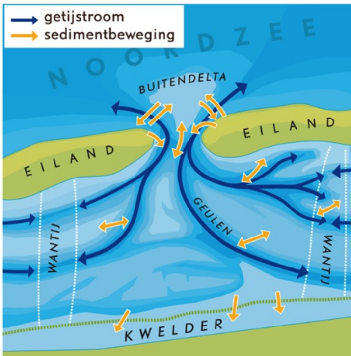
Figuur 2. Schematische weergave van de getijstromen en sedimentbewegingen in de Waddenzee.

Op de kwelders wordt het sediment extra goed vastgehouden door de vegetatie. Hierdoor worden kwelders steeds hoger. De meeste kwelders langs de vastelandskust zijn zo hoog dat ze nauwelijks nog overstromen en begroeid zijn met climaxvegetatie. Op de wadplaten kunnen algen(matten) een rol spelen in het vasthouden van sediment. Het aandeel zeegras in de Waddenzee is beperkt. Biota, zoals wormen en krabbetjes, kunnen door het omwerken van sediment er juist weer voor zorgen dat dit materiaal makkelijker erodeert.